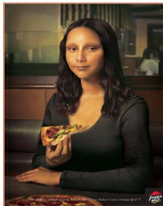
Pizza Hut, Classic Italian - Mona Lisa (c) Gavin Simpson Ogilvy Malaysia 2003

Mit diesem Newsletter wollen wir Euch auch ein paar Änderungen in 2025 mitteilen. Wie Ihr es gewohnt seid, können alle Veranstaltungen auf unserer Webseite weiterhin eingesehen werden, jedoch ist es nicht mehr erforderlich, sich direkt auf der Internetseite anzumelden. Als Anmeldung gilt die Überweisung mit Angabe der jeweiligen Veranstaltung, der Teilnehmer Namen und für Nicht BiKult Mitglieder die Angabe einer Telefonnummer für evtl. Rückfragen. Wir hoffen, damit einen besseren Anmeldeprozess für alle zu gewährleisten.